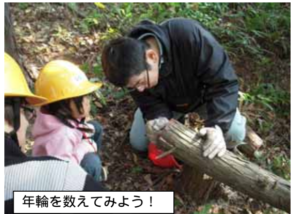
年輪を数えてみよう！