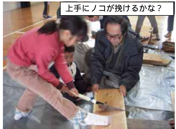
上手にノコが挽けるかな？