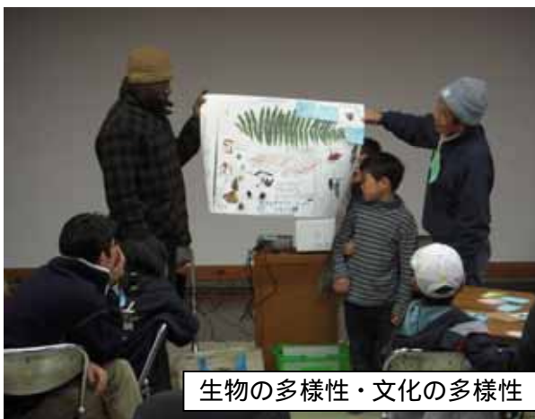
生物の多様性・文化の多様性