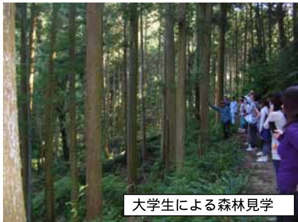
大学生による森林見学