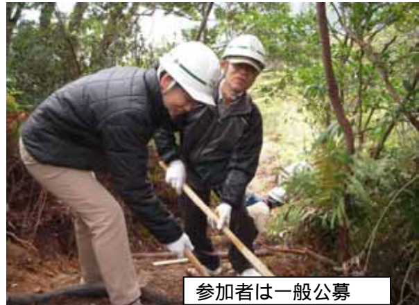
参加者は一般公募