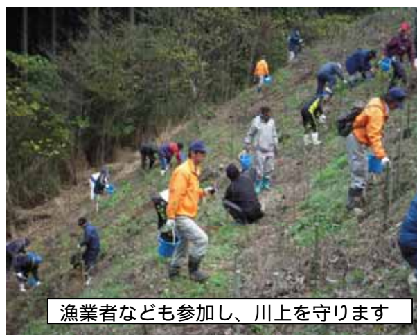
漁業者なども参加し、川上を守ります