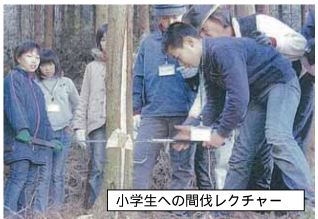
小学生への間伐レクチャー