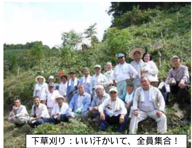
下草刈り：いい汗かいて、全員集合！