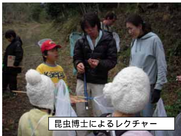
昆虫博士によるレクチャー