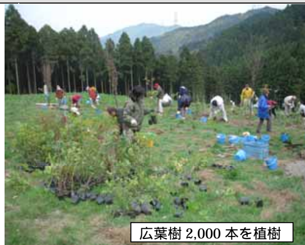
広葉樹 2,000 本を植樹