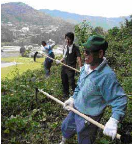
下草刈り：大鎌が格好いい！