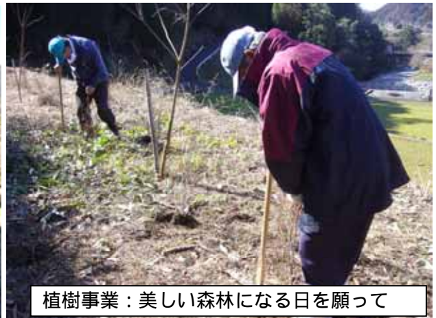
植樹事業：美しい森林になる日を願って