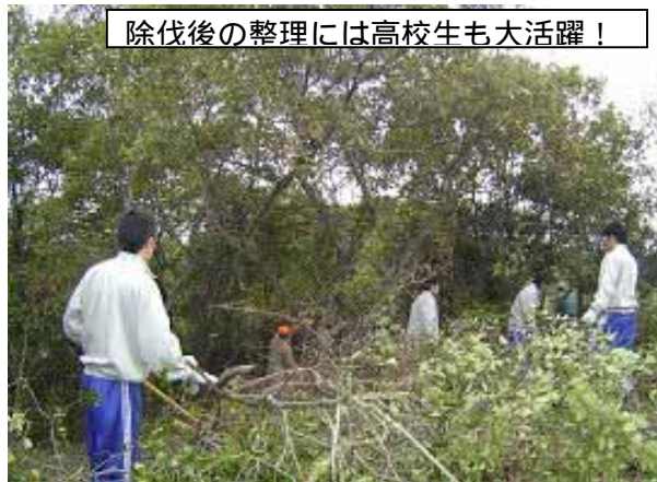
除伐後の整理には高校生も大活躍！