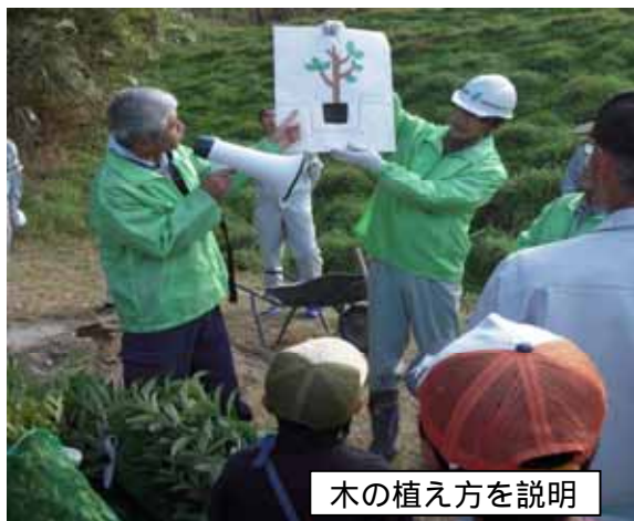
木の植え方を説明