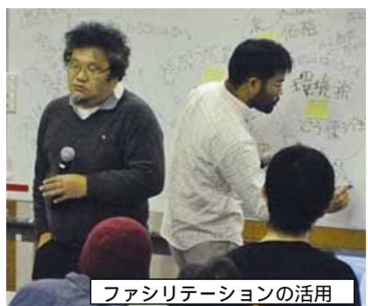
ファシリテーションの活用