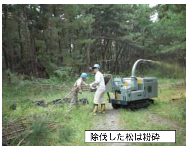
除伐した松は粉碎