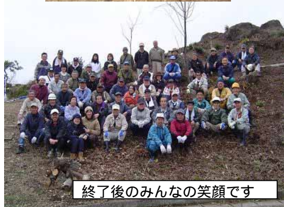
終了後のみんなの笑顔です