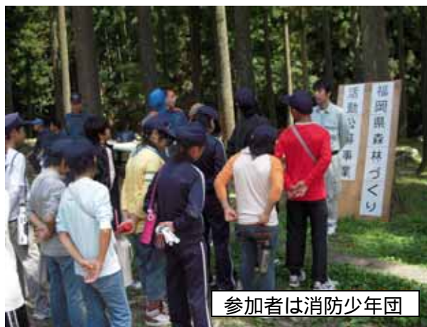
参加者は消防少年団