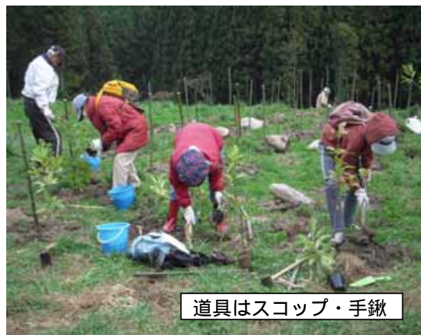
道具はスコップ・手鋤