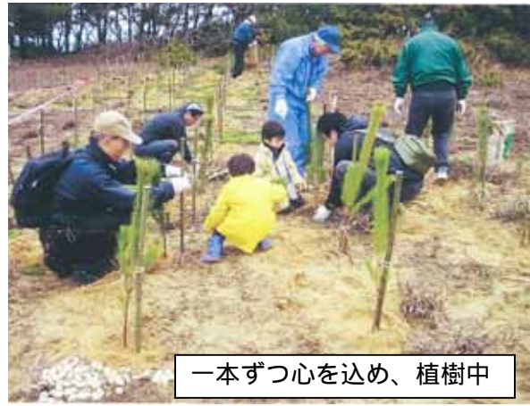
一本ずつ心を込め、植樹中