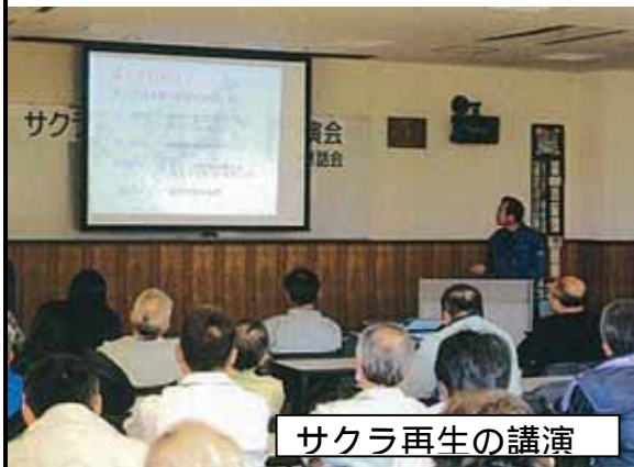
サクラ再生の講演