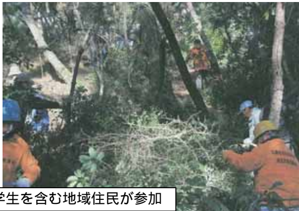
除伐・間伐：地元中学生を含む地域住民が参加