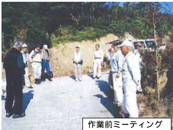
作業前ミーティング