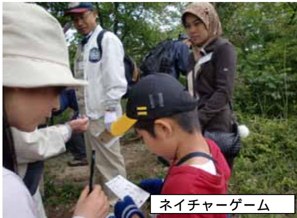
ネイチャーゲーム