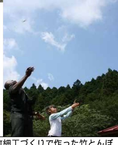
竹細工づくりで作った竹とんぼ