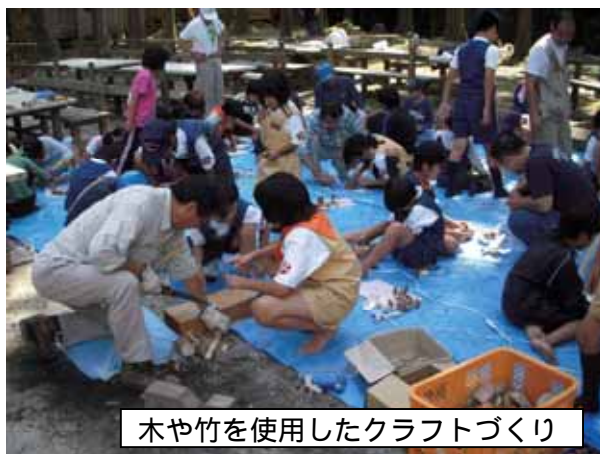
木や竹を使用したクラフトづくり