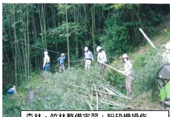
森林・竹林整備実習：粉碎機操作