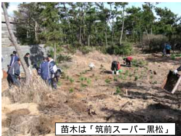
苗木は「筑前スーパー黒松」