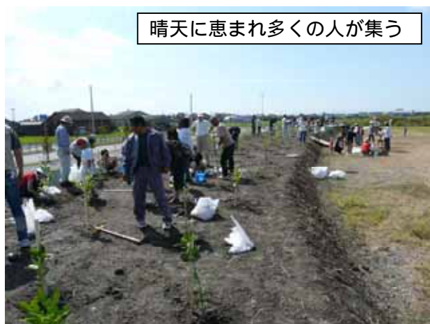
晴天に恵まれ多くの人が集う