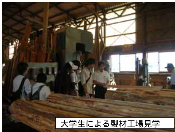
大学生による製材工場見学