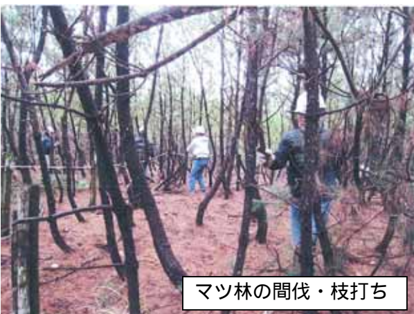
マツ林の間伐・枝打ち