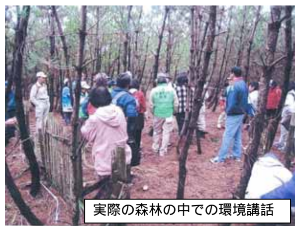
実際の森林の中での環境講話