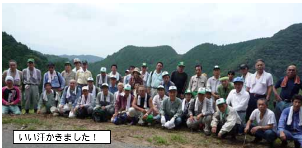
いい汗かきました！