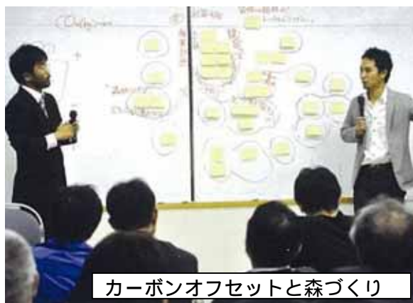
カーボンオフセットと森づくり