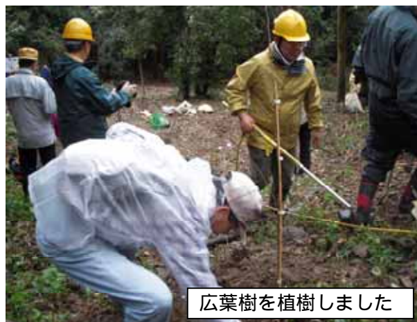
広葉樹を植樹しました