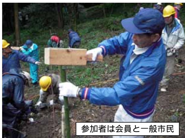
参加者は会員と一般市民