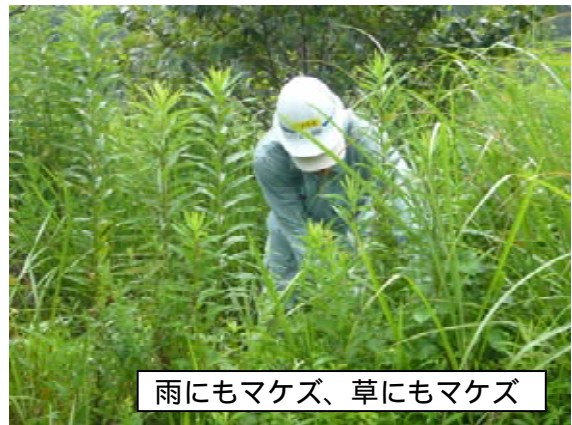
雨にもマケズ、草にもマケズ