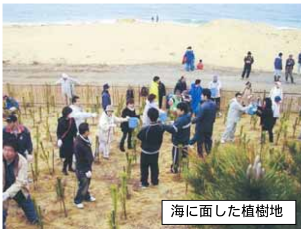
海に面した植樹地