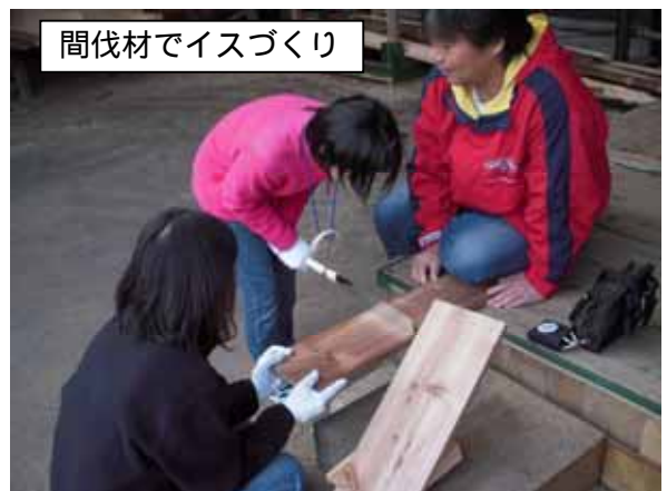
間伐材でイスづくり