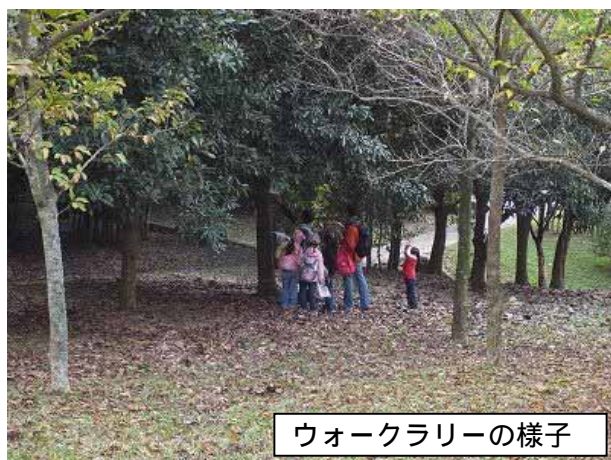
ウォークラリーの様子