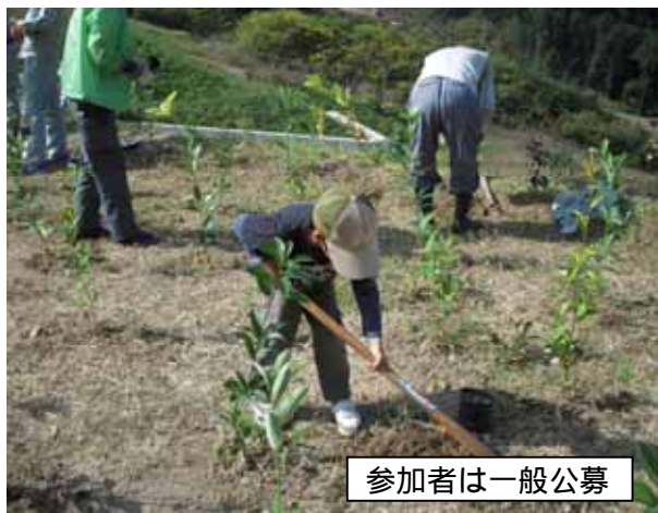
参加者は一般公募