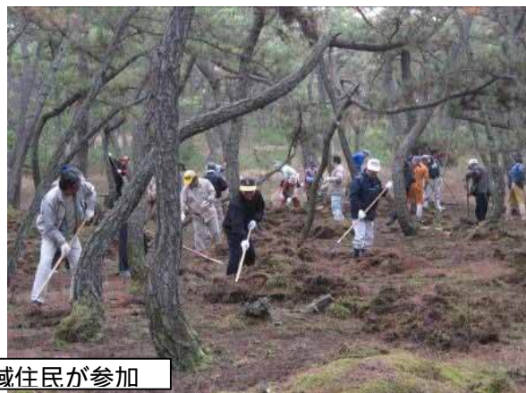
松葉かき：地域住民が参加