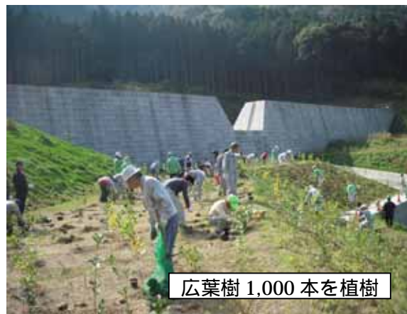
広葉樹 1,000 本を植樹