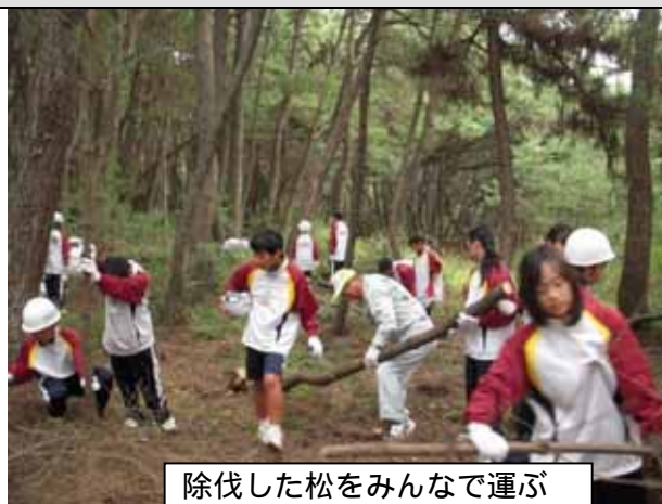
除伐した松をみんなで運ぶ