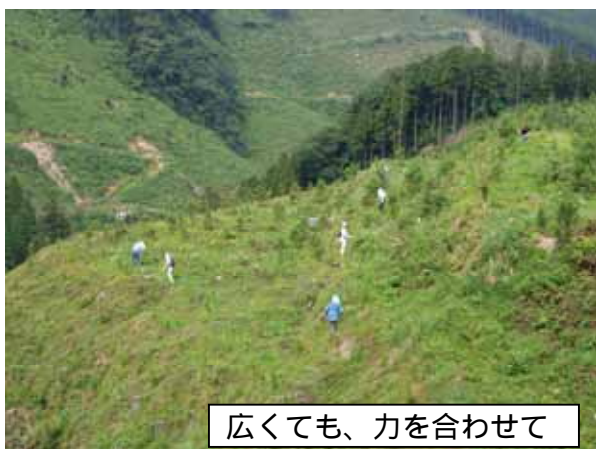
広くても、力を合わせて