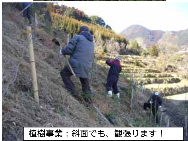
植樹事業：斜面でも、観張ります！