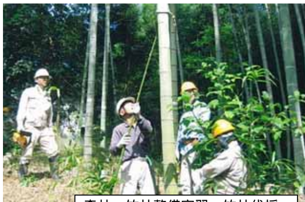
森林・竹林整備実習：竹林伐採