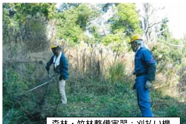
森林・竹林整備実習：刈払い機