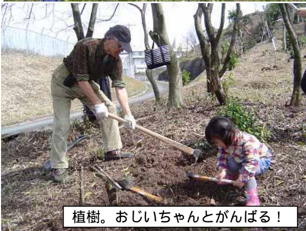
植樹。おじいちゃんとかんぱる！