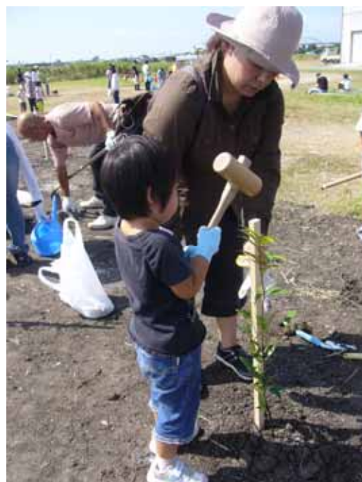
親子連れも多数参加！