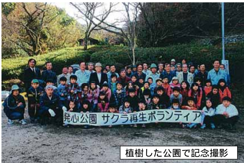
植樹した公園で記念撮影